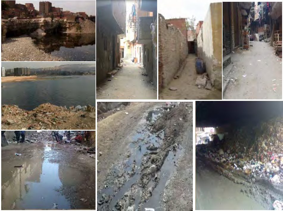
شكل (6) يوضح أهم المشكلات الراهنة بمنطقة "عزبة خير الله" بالقاهرة

تعانى المنطقة من العديد من المشكلات البيئية، حيث انتشار القمامة في الشوارع والممرات داخل المنطقة، و وجود البحيرة حيث تعتبر مصدر أساسي لتلوث البيئة في المنطقة، بالإضافة إلى التلوث البصري نتيجة الشكل العام للمباني وعدم تناسق الواجهات وانتشار القمامة، وأيضاً طحح المجارى والصرف الصحى المستمر يتسبب فى تلوث البيئة وانتشار الروائح الكريهة والحشرات والأمراض والأوبئة، وانتشار المصانع والورش الحرفية داخل المناطق السكنية وبالقرب منها، مما يسبب التلوث البيئى وانتشار الأمراض بين الأهالى.