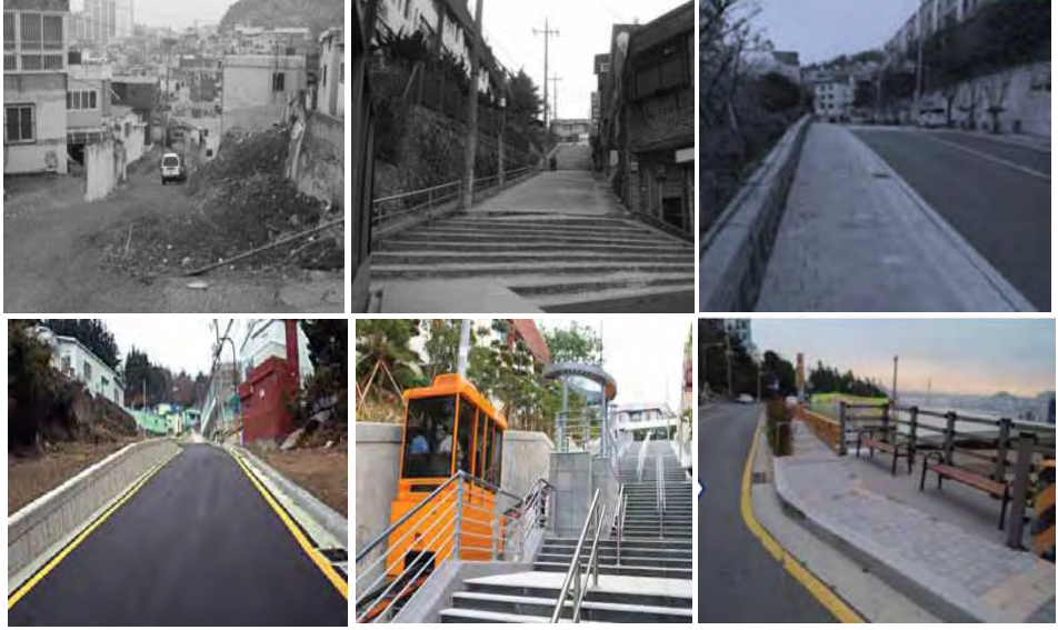
شكل (4) يوضح منطقة " صن بوكودورو - بوسان - كوريا الجنوبية " قبل وبعد مشروع التطوير

التكنولوجيا في تحقيق الاستدامة، وحازت قرية "جام شون" - إحدى القرى بالمنطقة - بعد التطوير على لقب "القرية الأكثر ابتداء في آسيا".