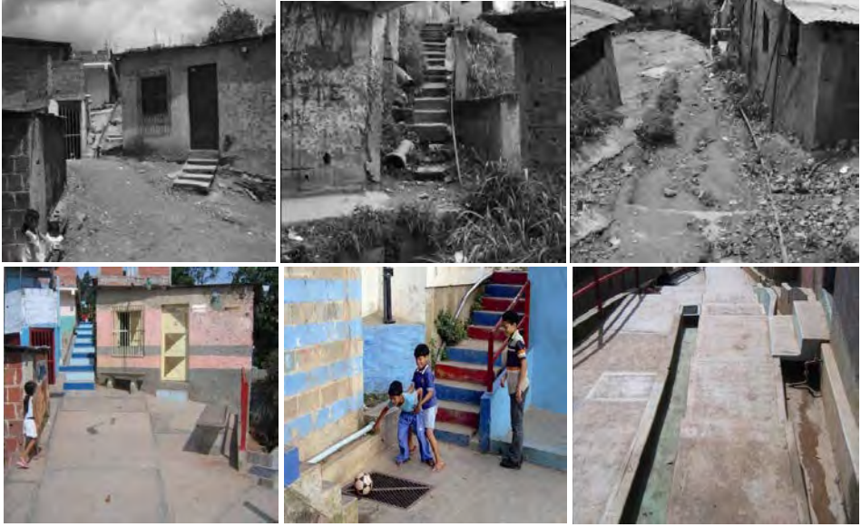
شكل (3) يوضح منطقة " سان رافايل - كاراكس - فنزويلا" قبل وبعد مشروع التطوير

متابعة ، واستخدام التكنولوجيا في تحقيق الاستدامة ، وحاز المشروع على جائزة ( هولسيم Holcim ) للتنمية المستدامة .