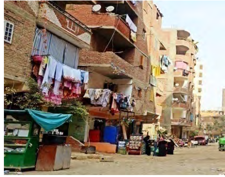
شكل (1) يوضح شكل المناطق العشوائية المقبولة عمرانيا