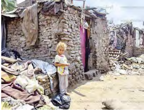
شكل (2) يوضح شكل المناطق العشوائية الغير مقبولة عمرانيا

ومن هنا يمكن تعريف المناطق العشوائية المقبولة عمرانيا على أنها "المناطق التى لا تحتاج لإزالة كاملة - كالمناطق الغير آمنة كمساكن العشش والصفيح والكرتون وغيرها من المواد الرديئة التى تبنى بها المساكن فى بعض المناطق العشوائية - إنما هى مناطق تحتاج مشروعات للتنمية والإرتقاء (بمختلف أنواعه) ، فهى مناطق آمنة وحالتها العمرانية مقبولة نوعا ما (كل منطقة حسب حالتها) ، والنسبة الأكبر من مبانيها بحالة جيدة إنشائيا ، قد تحتاج لبعض أعمال الصيانة والترميم أو مجرد أعمال تشطيبات فقط ، فهى مناطق قد تنقصها بعض الخدمات العامة أو خدمات البنية التحتية ، أو يلزمها الحيازة القانونية ، أو تعانى من التدهور الإقتصادى أو الإجتماعى أو البيئى".