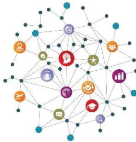
شكل رقم (1) الشبكة العالمية للتفاعلات التكنولوجية والبشرية

ويتكون الاقتصاد الجديد من شبكة عالمية للتفاعلات التكنولوجية والبشرية المعقدة، تشمل حلقات تغذية متعددة تعمل بعيدا عن التوازن، مما ينتج عنه تنوع لا ينتهي من الظواهر الناشئة. ويذكر " Capra" 2 أن "الكائنات الحية والنظم الإيكولوجية (النظم البيئية) قد تصبح غير مستقرة بشكل مستمر، وإذا فعلت ذلك، فإنها ستختفي في نهاية المطاف بسبب الانتقاء الطبيعي، ولم يبق على قيد الحياة سوي تلك النظم التي لديها السبل لتحقيق الاستقرار". أما في المجال البشري، يجب إدخال هذه العمليات في الاقتصاد العالمي من خلال الوعي البشري الثقافي والسياسي. لذا فنحن بحاجة إلى تصميم وتنفيذ آليات تنظيمية لتحقيق الاستقرار في الاقتصاد الجديد " Capra (2002: p.140).